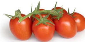
Plommontomat på kvist