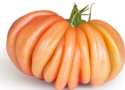
Stor Herr Tomat