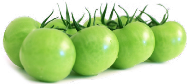
Grön kvisttomat Inspirerad av filmen "Stekta gröna tomater"? Då är detta rätt tomat. Den kan stekas, grillas eller kokas!