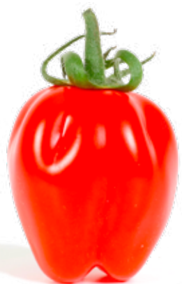
Jordgubbstomat Fast tomat med rolig form och god smak. Passar perfekt som snacks.