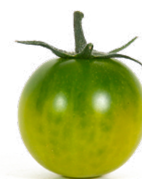
Kiwitomat En fräsch och smakrik tomat med kraftigt skal.