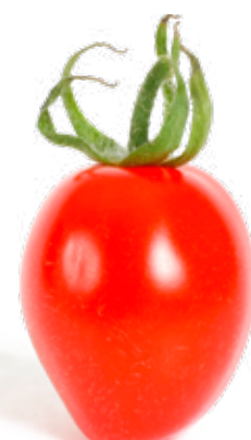
Röd plommontomat Kan med sitt fasta kött och goda smak användas till det mesta.