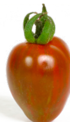
Choko körsbärstomat En vacker mild tomat med spänstigt skal.