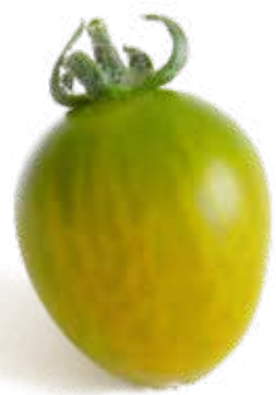
Äppeltomat En tomat med fräsch smak. Knaprig i både kött och skal, blunda och tänk på ett Granny Smith-äpple.