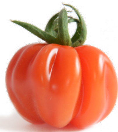
Herr Tomat Inspirerad av Elsa Beskow's karaktär från "Görans bok". Mild smak, fast kött och saftig. Passar att grillas.