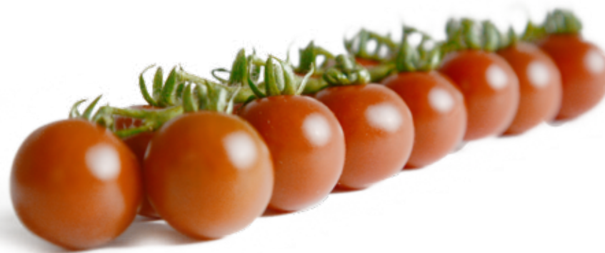
Brun körsbärstomat på kvist En smakrik och god tomat med ett lite tjockare skal.