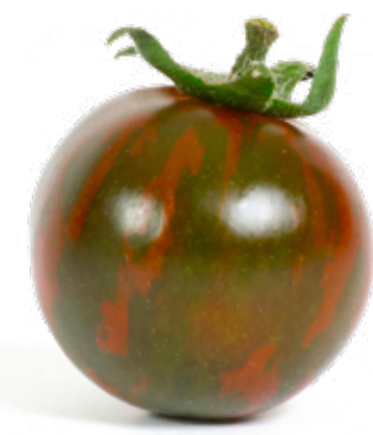
Tigertomat Tomat med fast kött, mycket tomat smak och kraftigt skal. Vacker att skiva.