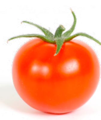
Röd körsbärstomat Saftig, söt och kryddig i smaken.