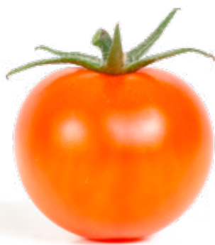
Krusbärstomat Smakrik tomat med fast konsistens och en överraskande smak.