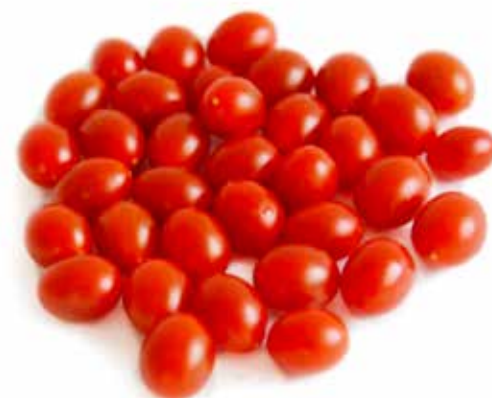
Söta Karin En fast tomat som är lätt att tugga i sig som snacks.