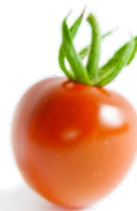
Druvtomat En smakrik tomat med fast kött och skal. Perfekt att skiva ner i en sallad.