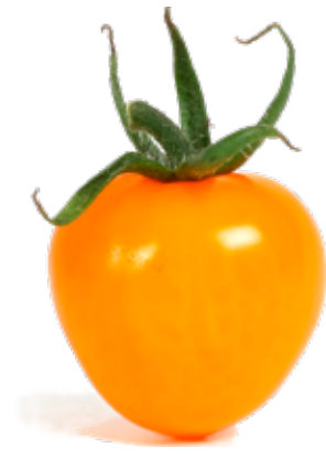
Orange körsbärstomat Fräsch tomat som med sin pigga smak passar väldigt bra i exempelvis en sallad.