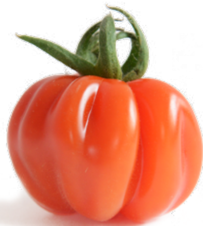
Herr Tomat Inspirerad av Elsa Beskows karaktär från "Görans bok". Mild smak, fast kött och saftig. Passar att grillas.