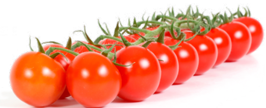
Körsbärstomat på kvist En utsökt tomat med söt smak.