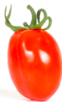
Mini San Marzano En tomat med karaktärsrik smak och fast skal.