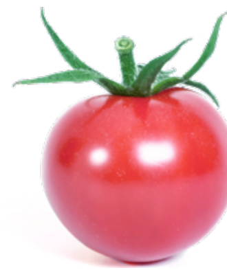
Rosa körsbärstomat Med den överraskande smakförstärkaren umami.