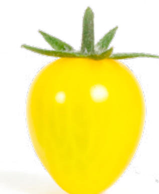
Ljusgul plommontomat En väldigt syrlig tomat med mycket smak och kraftigt skal.