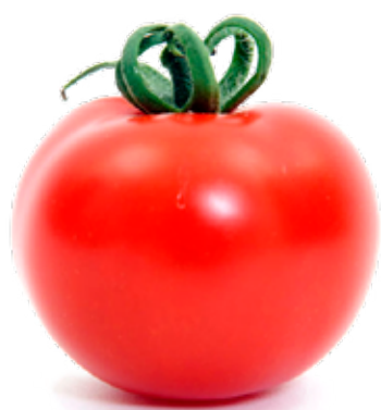
Torptomat Smakar som tomater gjorde förr. En klassisk, god smak.