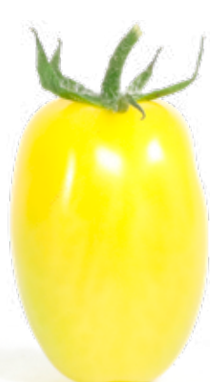
Soltomat Syrlig tomat med fin färg och fast kött.