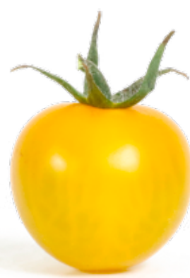
Gul körsbärstomat En tomat som med sin pigga smak kan användas till sallad eller ätas som den är.