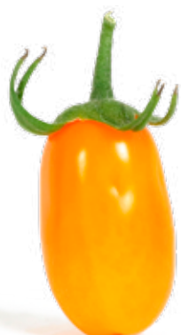
Pärontomat Saftig tomat med söt och mild smak.