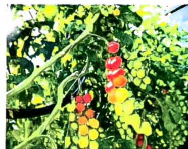
Tomater på kvist är huvudprodukten. De skördas senare och får därmed en bättre smak.