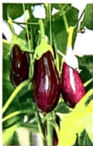
Auberginerna är av lite mindre storlek än de importerade och har blivit en allt mer efterfrågad produkt.