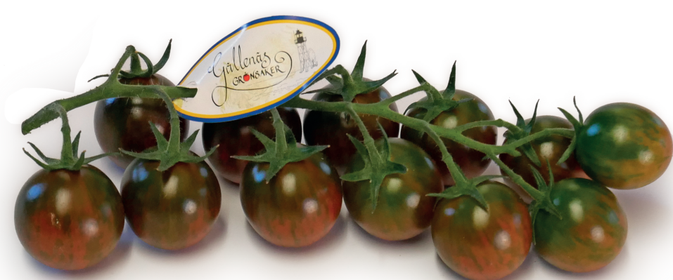
Grillo på kvist