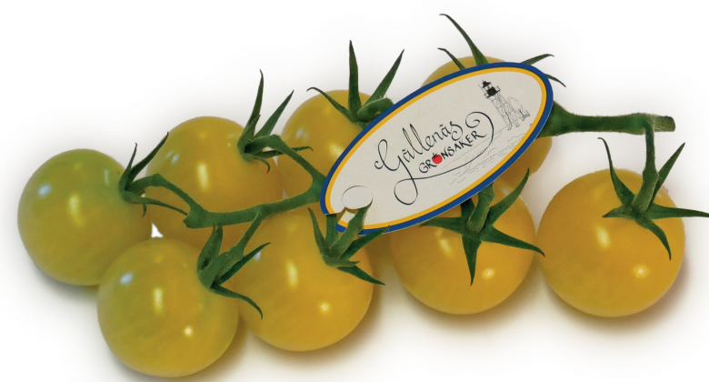
Körsbärstomat Vanilla på kvist