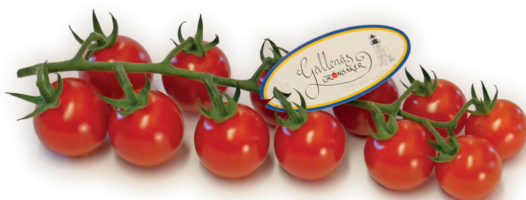
Röd körsbärstomat på kvist

Persiko- och krusbärssmak, som övergår i en sötare och fylligare tomatsås smak när den grillas