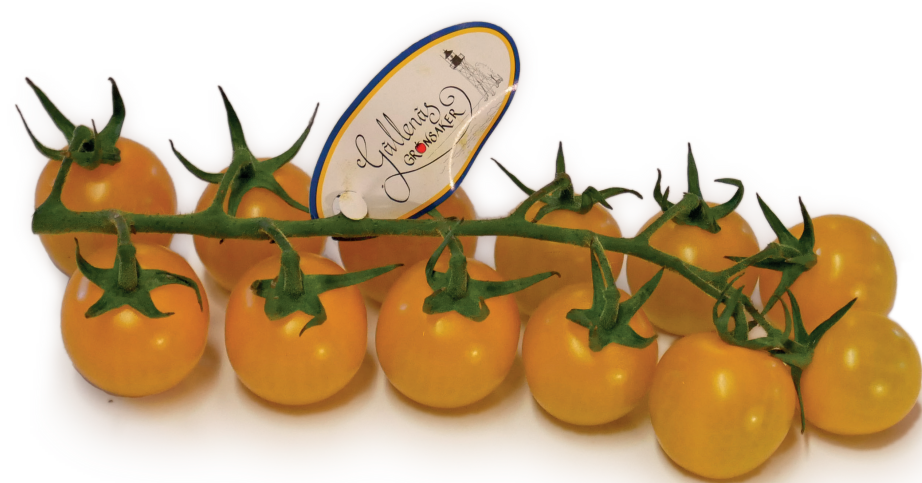
Mörkgul körsbärstomat på kvist