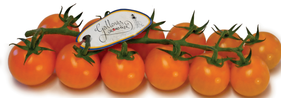
Orange körsbärstomat på kvist